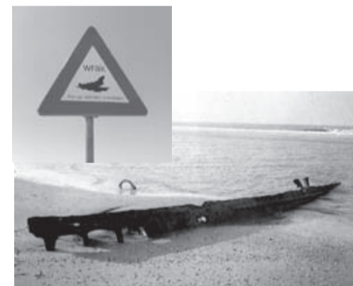
De Heemskerk steekt na elke storm weer de kop op bij het Noorderbad. Foto uit 1988

Op dit moment is Bert bezig een monument in het leven te roepen voor de opvarenden van het Italiaanse schip "De Salento" dat in november 80 jaar geleden met man en muis