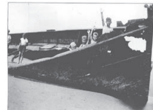
Het wrak van De Heemskerk werd lang als speelplek gebruikt. Foto uit 1935

'Als ze me nodig hebben, weten ze me allemaal te vinden. Zo heb ik in 2003 ter gelegenheid van de 100 jaar geleden gezonken Vrijheid een tentoonstelling in de Moriaan georganiseerd.